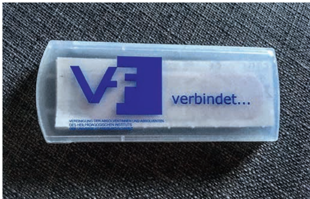
VAF-Böxli verbindet

Der freigewordene Platz im VAF-Vorstand soll aber möglichst schnell wiederbesetzt werden. Ein Vereinsmitglied hat bereits sein Interesse daran angemeldet, künftig im Vorstand mitzuarbeiten; die Interessentin wird an die nächste Vorstandssitzung eingeladen, damit sich beide Seiten ein Bild voneinander machen können. Zudem sind wir nach wie vor auf der Suche nach einer Vertretung der Logopädie im Vorstand. Einzelne Vorstandsmitglieder haben verlauten lassen, dass sie ihre persönlichen Beziehungen zu ehemaligen Logopädie-Studierenden spielen lassen wollen, indem sie geeignete Leute direkt ansprechen. Aber natürlich würden wir uns auch über spontane Bewerbungen von Logopäd/innen sehr freuen!