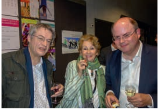
Impressions de la journée Alumni 2019 • Impressionen vom Alumni-Tag 2019